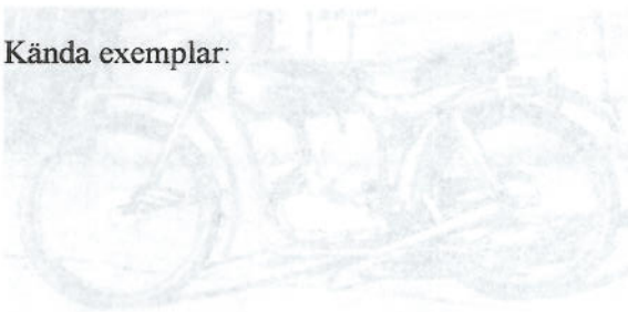
16) Rusch Sport 50 (1) bottenlänkgaffel