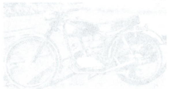
19) Rusch Sport 50 (1) teleskopdämpare