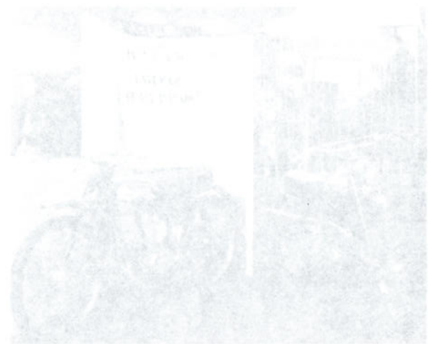
18) I ställning med två Rusch Sport 50-er